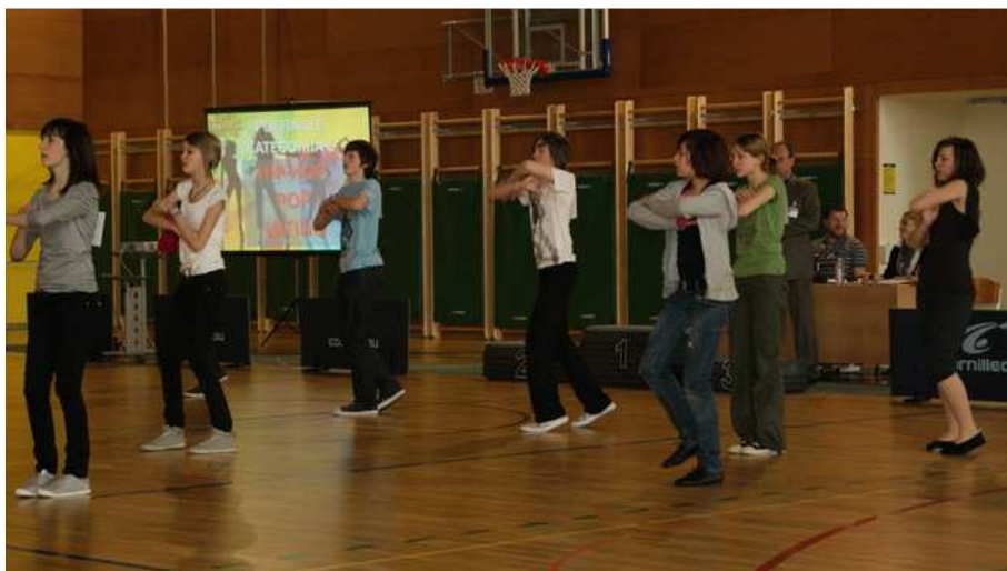
Učenci naše šole so uspešno sodelovali v projektu Šolski plesni festival – ŠPF (Sveta Ana, 25. marec 2011)

Koledar za osnovne šole je urejen s Pravilnikom o šolskem koledarju za osnovne šole (Ur. list 63/08, 45/10). S tem pravilnikom se urejajo vpis otrok, rasporeditev pouka, pouka prosti dnevi in rasporeditev ter trajanje šolskih počitnic v šolskem letu za učence ter rasporeditev letnega dopusta, strokovnega izobraževanja in usposabljanja strokovnih delavcev, prav tako pa tudi roki za obveščanje staršev o učnem uspehu in dosežkih učencev pri nacionalnem preverjanju znanja. Novi pravilnik prinaša dve bistveni spremembi: zimske počitnice pričnejo tretji ponedeljek v februarju za vse šole širom po Sloveniji ter dva delovna dneva v šolskem letu ne glede na določila koledarja lahko šola določi sama, vendar ne na dan, ko že poteka pouk po urniku.