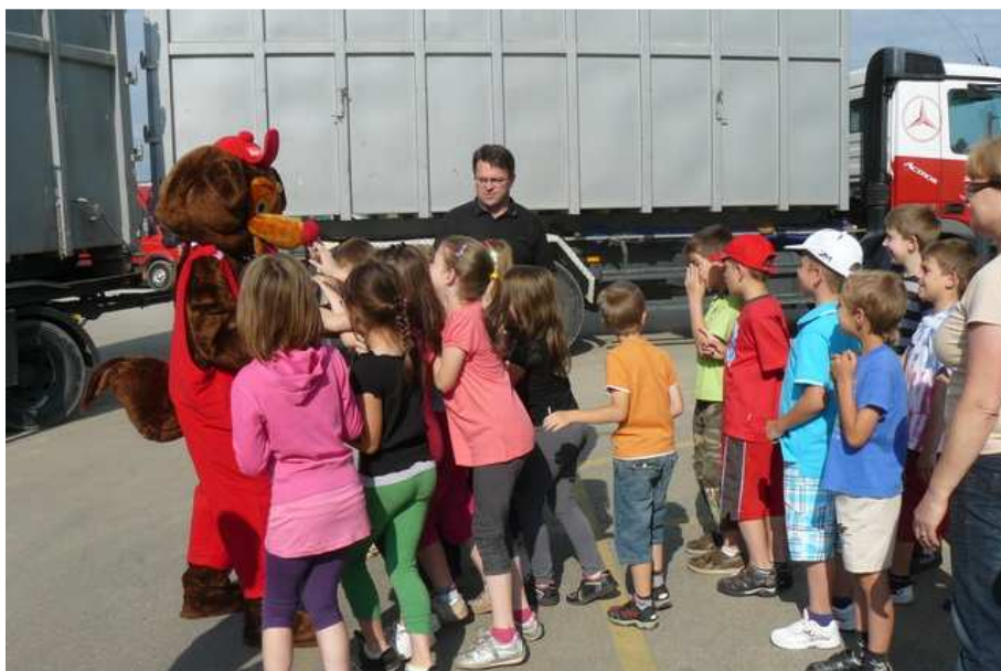
Učenci 2. razreda so obiskali podjetje Saubermacher v Lenartu (Lenart, 15. junij 2011)

Na podlagi novega Zakona o šolski prehrani (Ur. l. RS št.: 43/2010) je Svet zavoda na predlog ravnatelja potrdil t.i. Pravila šolske prehrane učencev OŠ Sveta Ana , ki natančneje določa postopke, ki zagotavljajo evidentiranje, nadzor nad koriščenjem obrokov, določajo čas in način odjave posameznega obroka, ravnanje z neprevzetimi obroki ter načine seznanitve učencev oziroma dijakov in staršev.